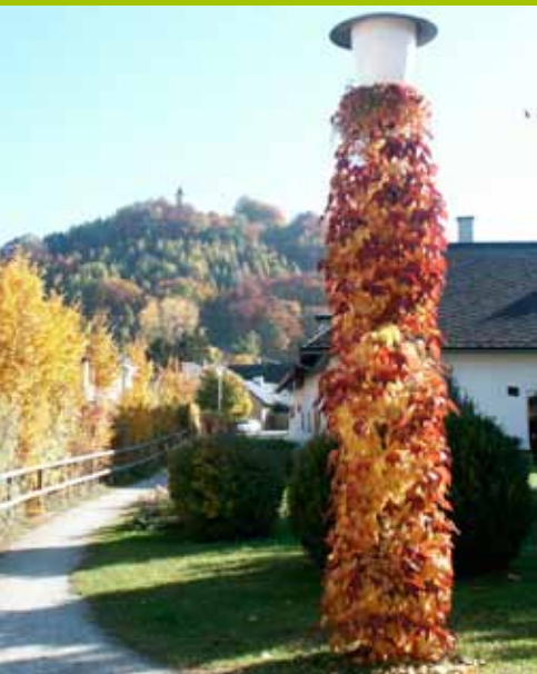
Herbststimmung in Micheldorf