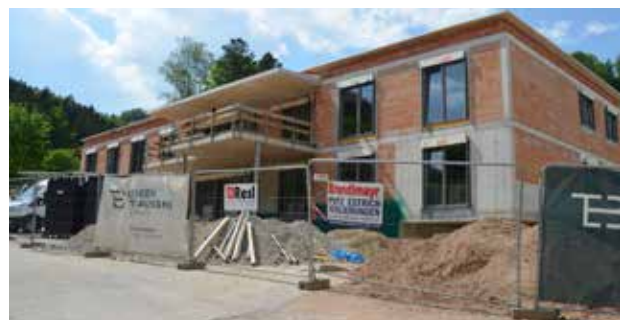
Die Baustelle Krämergütl

wollen, sind Sie gerne eingeladen, sich mit einer E-Mail an: zentrale@schoen-menschen.at zu melden.